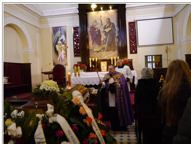
Zdjęcia z mszy pogrzebowej w Kościele śś. ap. Piotra i Pawła