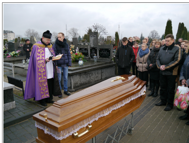
Odprowadzenie ciała na cmentarz i złożenie do grobu.