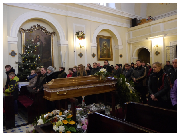
Zdjęcia z mszy pogrzebowej w Kościele śś. ap. Piotra i Pawła